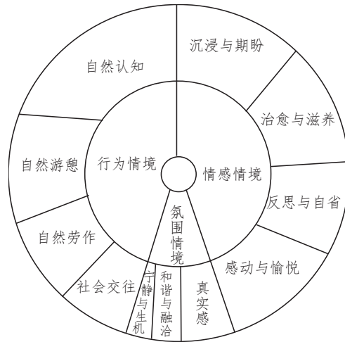
图1 自然研学旅游体验的三维分析模型

本研究通过系列编码后,构建自然研学旅游体验的三维分析模型(见图1)。其中,行为情境主要关注游客在研学旅游活动中开展各类行为活动,有自然认知、自然游憩、自然劳作、社会交往四个方面内容;氛围情境则是游客对旅游地环境氛围的感知,包括真实感、宁静与生机、和谐与融洽三个方面;情感情境是游客在活动中获得的情感体验,包含了感动与愉悦、治愈与滋养、反思与自省、沉浸与期盼四个方面。以下结合文本对三个维度的旅游体验展开具体分析。